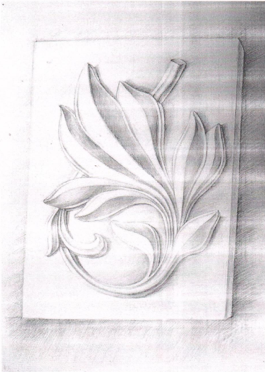
Рис. 1. Приклад виконання об'ємного зображення гіпсової розетки*

Примітка: Забороняється застосування креслярських інструментів. На екзамені забороняється використання мобільних телефонів та інших пристроїв. При собі обов'язково мати паспорт.