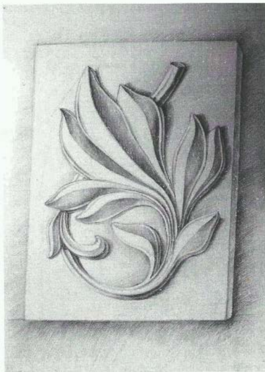
Рис. 1. Приклад виконання об'ємного зображення гіпсової розетки*

Примітка: Забороняється застосування креслярських інструментів. На екзамені забороняється використання мобільних телефонів та інших пристроїв. При собі обов'язково мати паспорт.