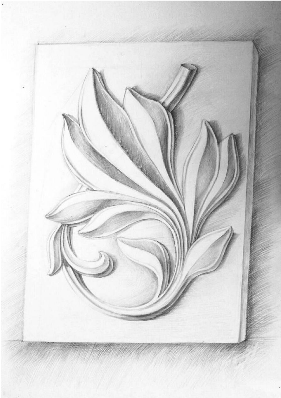
Рис. 1. Приклад виконання об'ємного зображення гіпсової розетки*

Примітка: Забороняється застосування креслярських інструментів. На екзамені забороняється використання мобільних телефонів та інших пристроїв. При собі обов'язково мати паспорт.