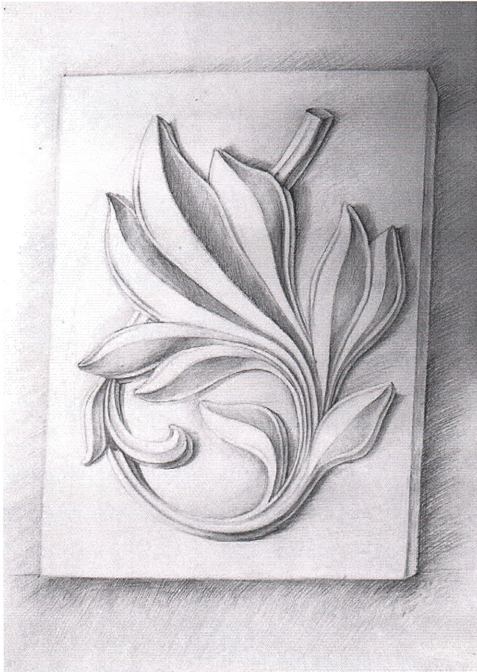
Рис. 1. Приклад виконання об'ємного зображення гіпсової розетки*

Примітка: Забороняється застосування креслярських інструментів. На екзамені забороняється використання мобільних телефонів та інших пристроїв. При собі обов'язково мати паспорт.