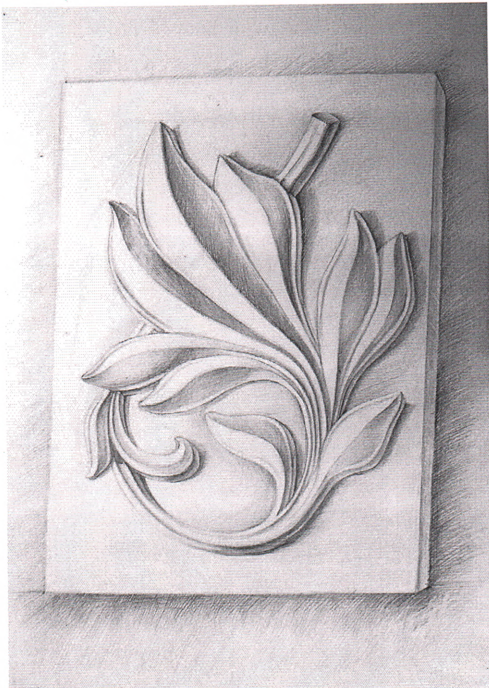
Рис. 1. Приклад виконання об'ємного зображення гіпсової розетки*

Примітка: Забороняється застосування креслярських інструментів. На екзамені забороняється використання мобільних телефонів та інших пристроїв. При собі обов'язково мати паспорт.