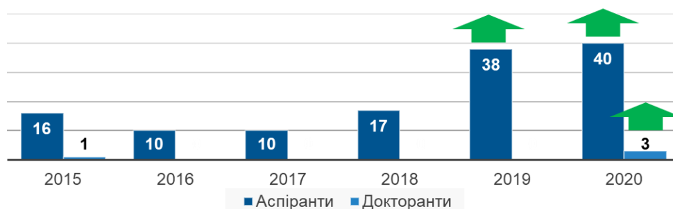
Динаміка вступу до аспірантури випускників університету

У 2020 році до аспірантури та докторантури університету зараховано 43 особи (здобувачами вищої освіти ступеня доктора філософії – 40 осіб та 3 особи – здобувачами наукового ступеня доктора наук).