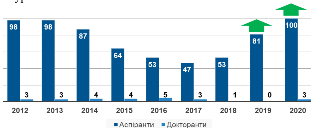
Чисельність аспірантів університету

Систематично проводиться робота з відбору та підготовки претендентів до вступу в аспірантуру та докторантуру, зростає кількість вступників, які мають значний науковий доробок за темою майбутньої дисертаційної роботи, наукові публікації у фахових виданнях, брали участь у роботі наукових конференцій, олімпіад, конкурсів, володіють іноземною мовою на високому рівні – і, як результат, підвищується ефективність роботи аспірантури та докторантури.