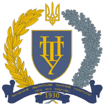
Великий герб університету