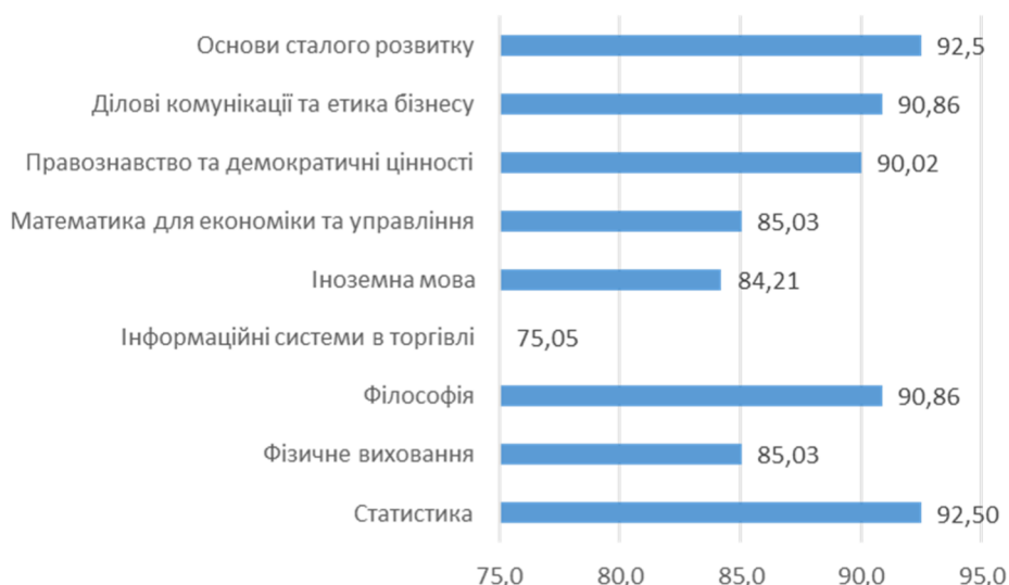
Рисунок 2 – Рівень забезпечення навчальними матеріалами у розрізі дисциплін (питання № 3)

Також питання 13) Оцініть, наскільки зміст навчально-методичних матеріалів, що розміщені на платформі дистанційної освіти Moodle, забезпечує виконання навчальних завдань та засвоєння матеріалу з дисципліни теж має рівень задоволення у середньому – 87,72%, у розрізі дисциплін (рис.2):