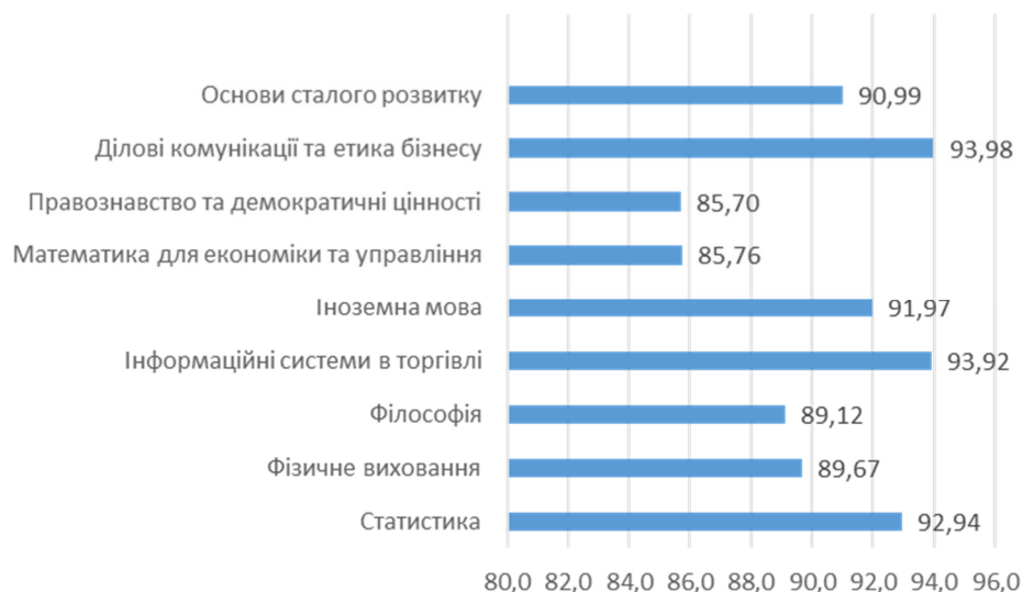
Рисунок 1 – Рівень задоволеності якістю освітнього процесу здобувачів спеціальності D7 Торгівля, ОР «бакалавр»

Разом з тим здобувачі виділили наступні аспекти навчального процесу, які доцільно врахувати для подальшого вдосконалення рівня задоволеності якістю, зокрема збільшити наявність реальних кейсів, інтерактивних вправ, консультації з фахівцями, щоб краще усвідомити свої можливості та перспективи кар'єрного зростання.